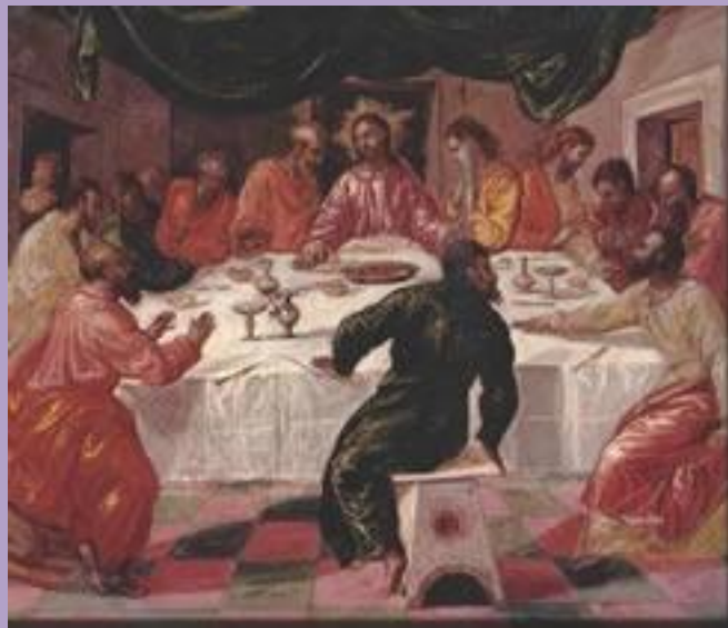
El Greco A Ultima Ceia