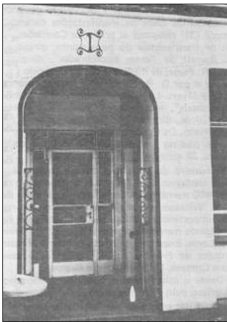
Sociedade para Pesquisas Psíquicas (Londres, 1973)

ponsáveis pelo direcionamento de suas atividades mediúnicas. Como ficou patenteado no período posterior ao retorno da terceira viagem à Inglaterra, provavelmente ela poderia ficar à mercê de outros interesses se não fosse a séria direção e até implacável vigiância exercida pela Sociedade.